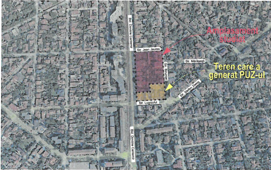
PLAN DE ÎNCADRARE SC. 1:10000

U01 ÎNCADRARE ÎN ZONĂ, sc. 1:10000 ÎNCADRARE ÎN LOCALITATE, sc. 1:5000