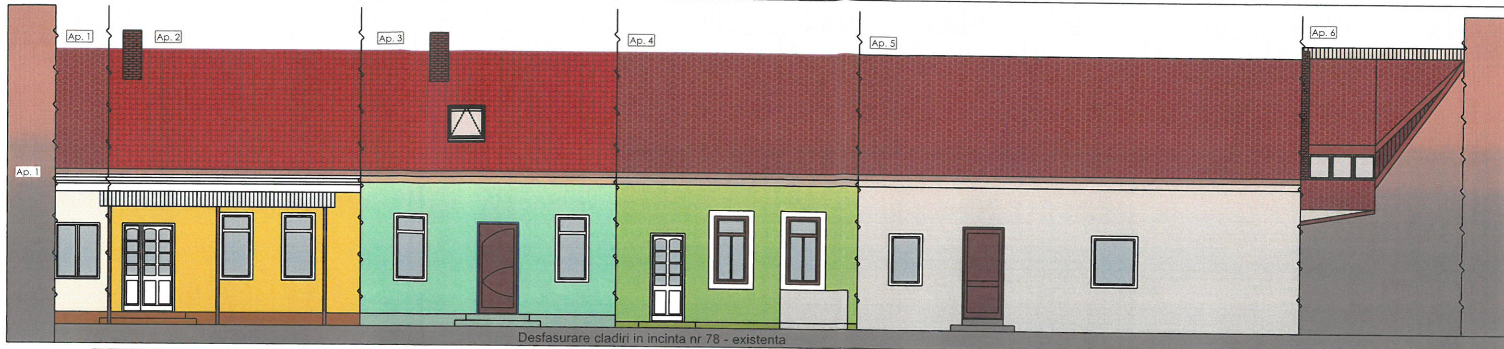
Desfasurare cladiri in incinta nr 78 - existenta