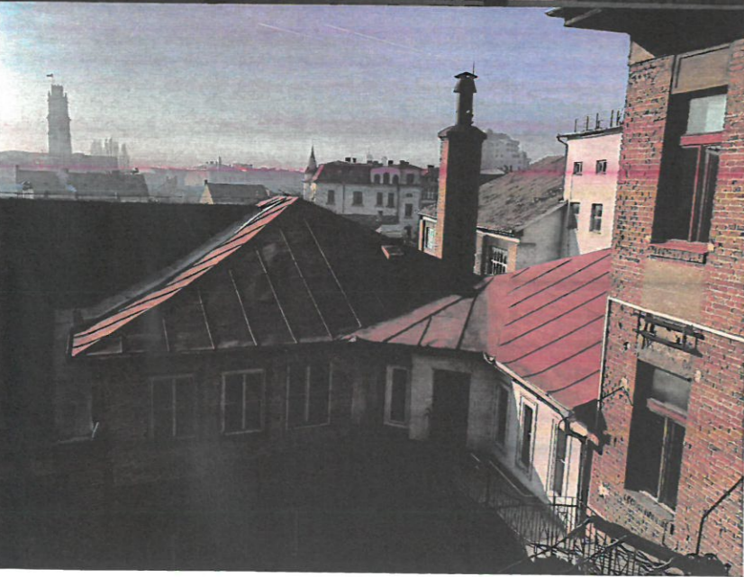
VEDERE CURTE INTERIOARA-CORP EXISTENT