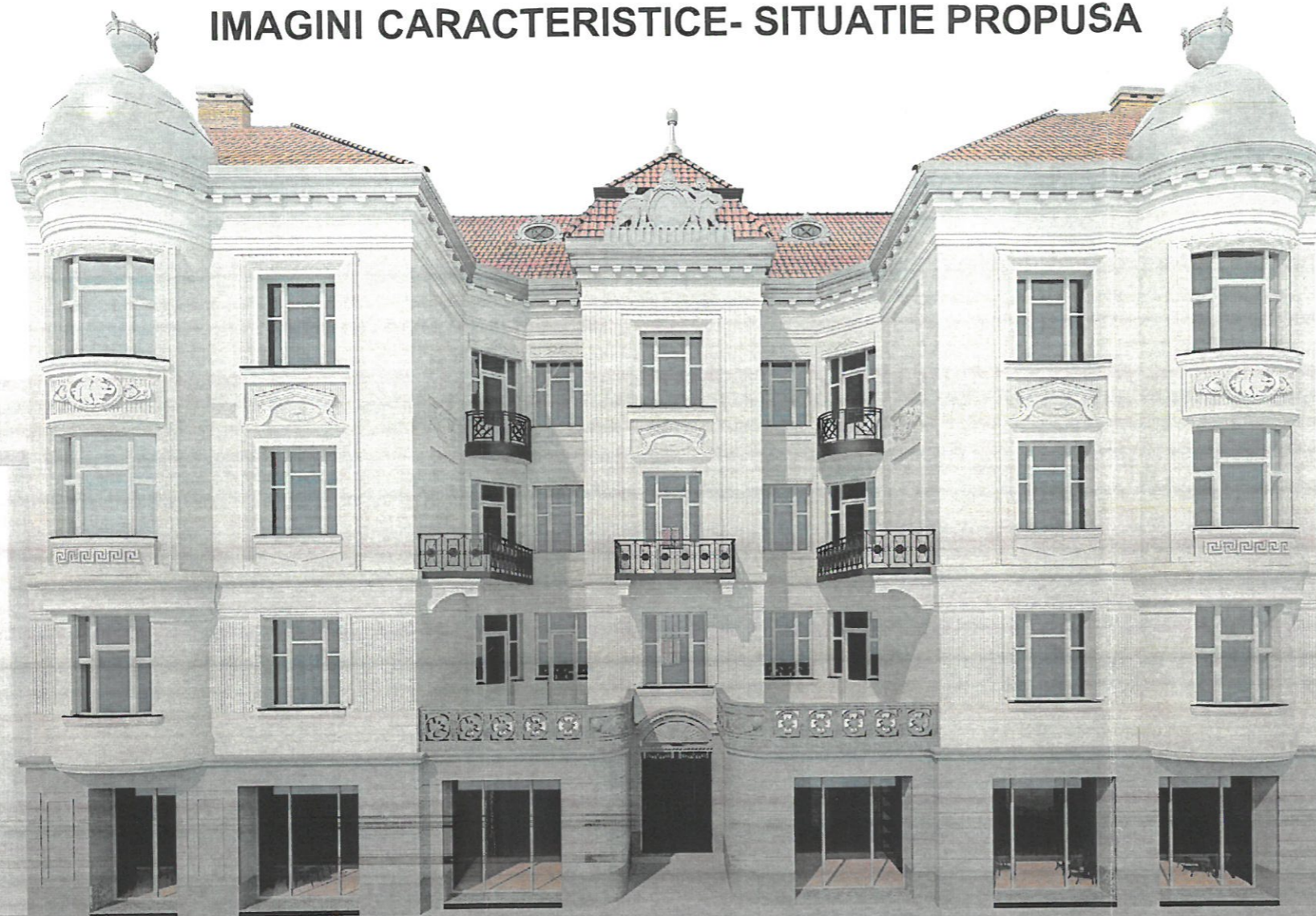
VEDERE STRADA MOSCOVEI

JUDETUL BIHOR PRIMĂRIA MUNICIPIULUI ORADEA ANEXA LA AVIZUL Nr. 920 din 6.05.2021 ARHITECT ȘEF