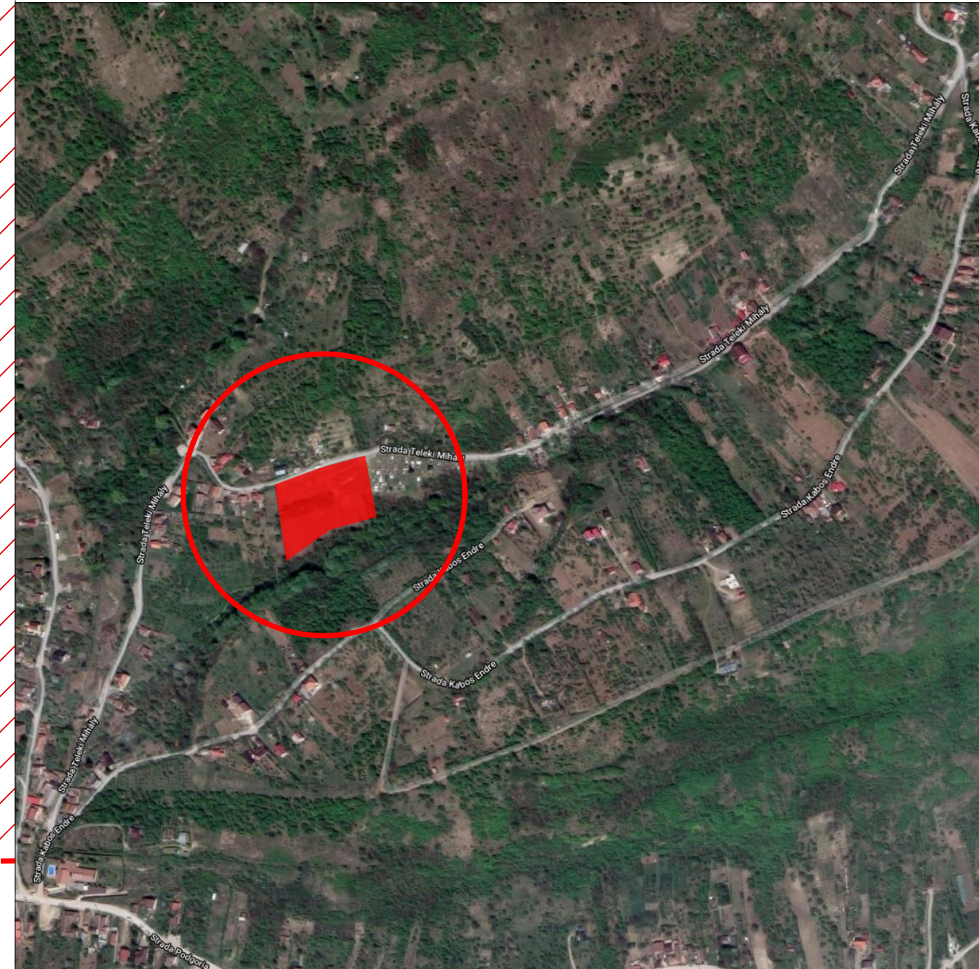
PLAN DE INCADRARE IN ZONA sc.1:5000