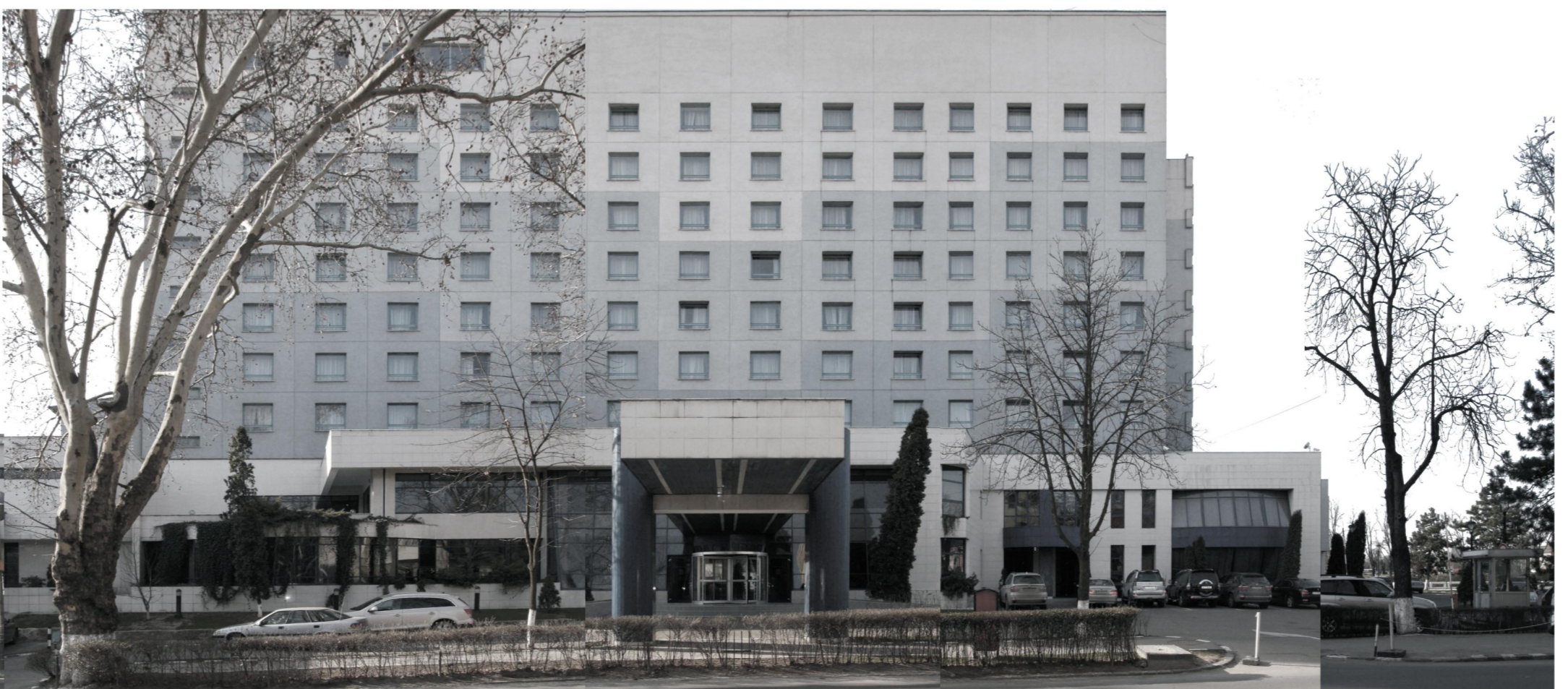
ALEEA STRANDULUI NR. 1-3