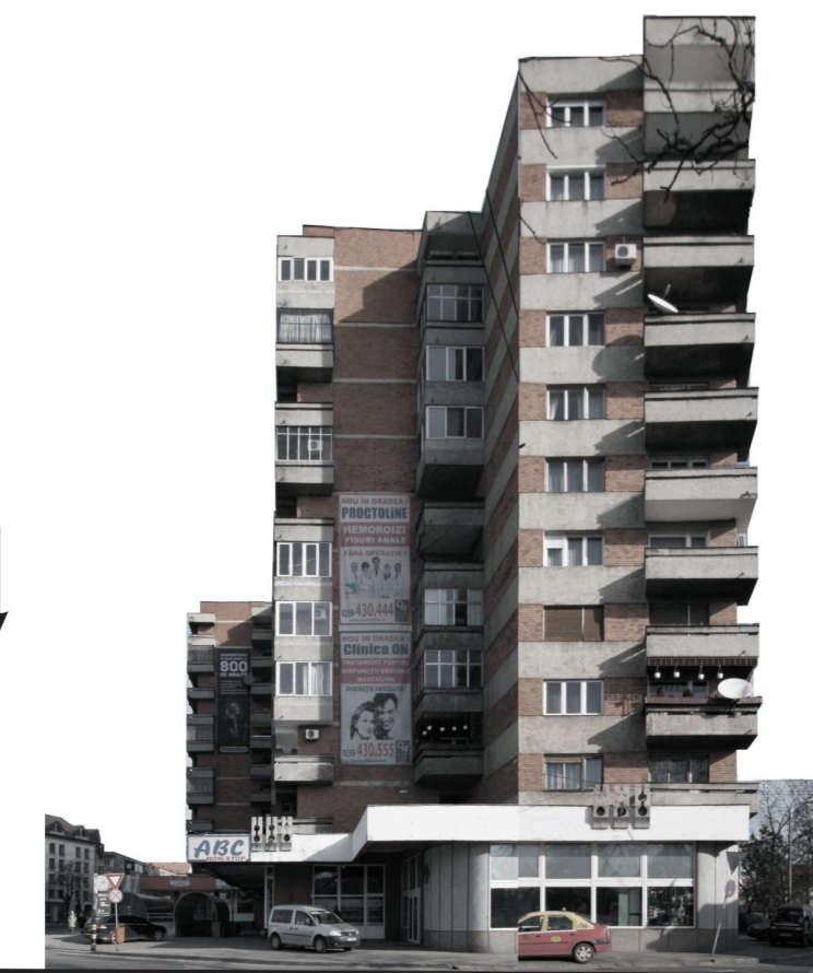
B-DUL. GENERAL. G. MAGHERU