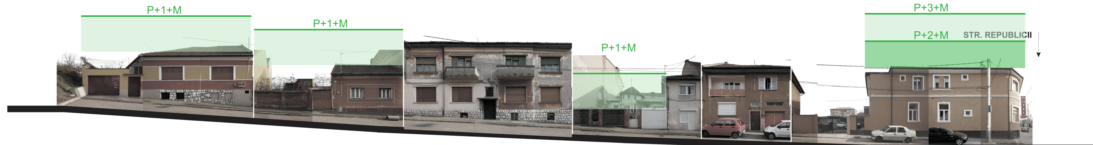
STR. BUCEGI NR. 1