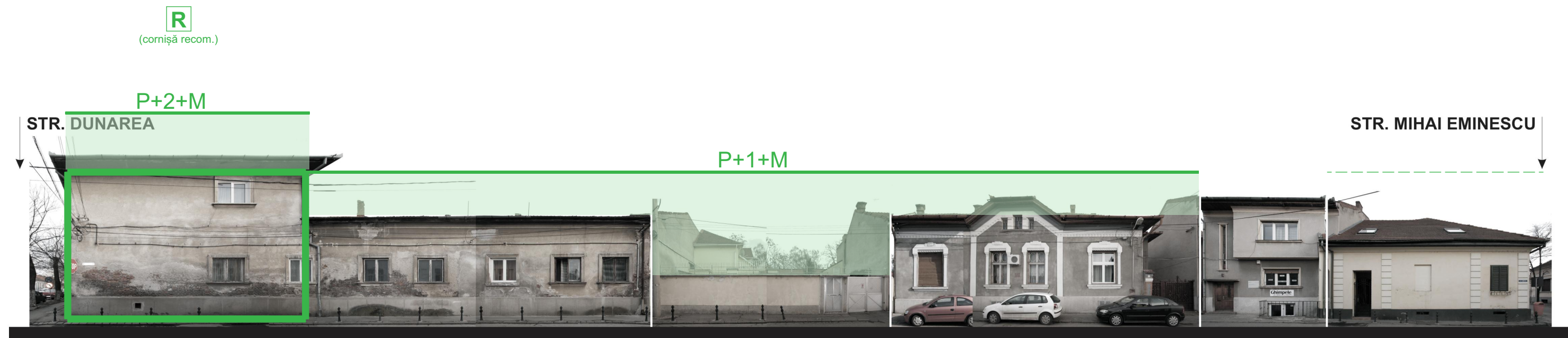
STR. COMETEI NR. 1-5