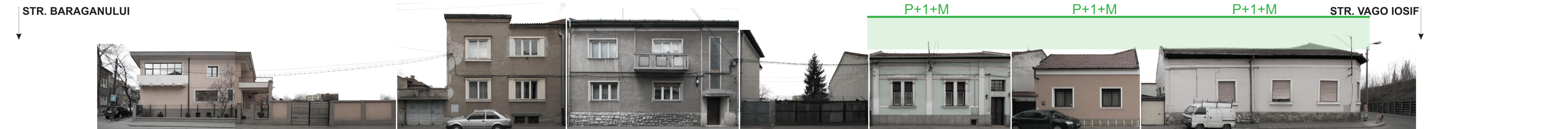
STR. GEORGE ENESCU NR. 40-52