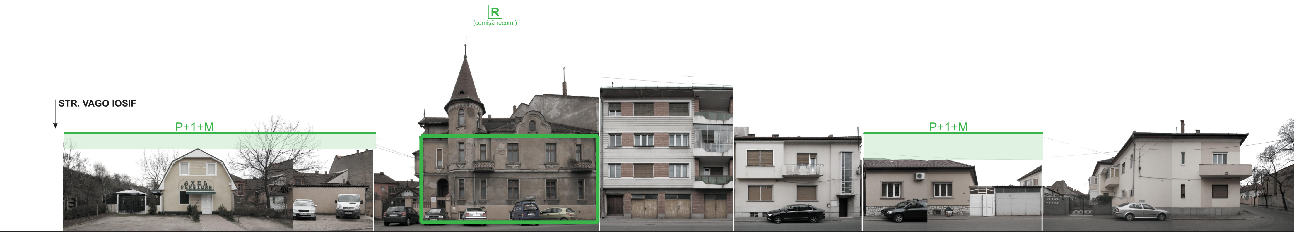
STR. GEORGE ENESCU NR. 49-57