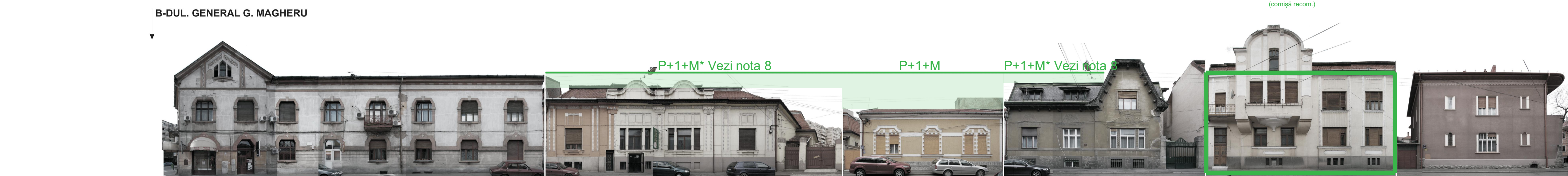
STR. GEORGE ENESCU NR. 30A-38