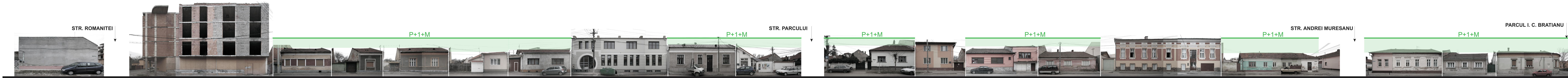
STR. ION HELIADE RADULESCU NR. 15-31