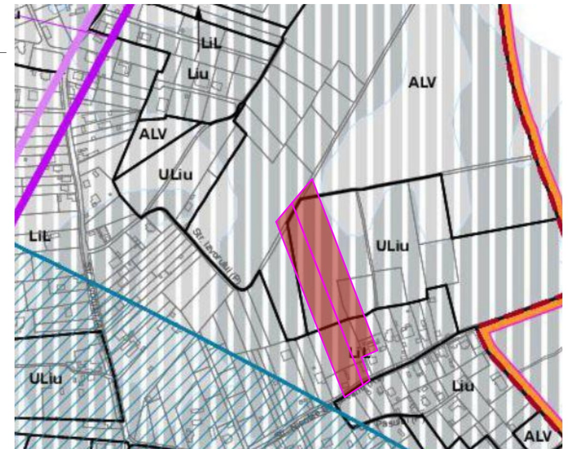
INCADRARE PUG ORADEA