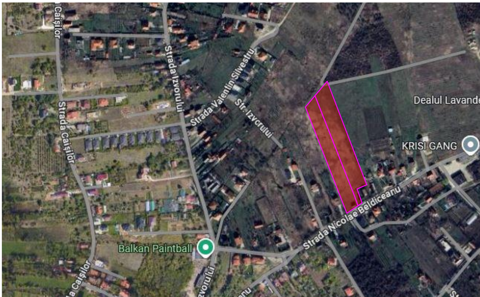
INCADRARE GOOGLE MAPS